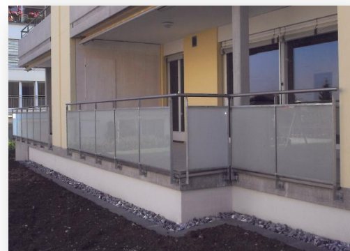
Ausführung mit Glasfüllung matt