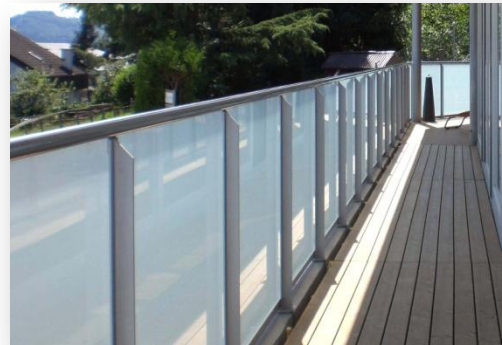
Handlauf mit Glasnut