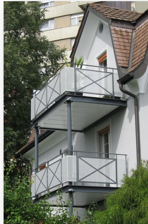
Lochblech-Füllung mit optimalem Andreaskreuz (Kundenwunsch)