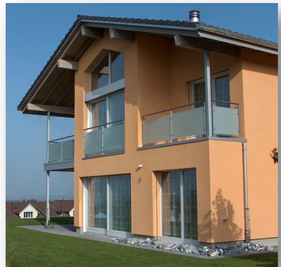
Pfosten in DUROPLEX Glasfüllung mit Mattfolie